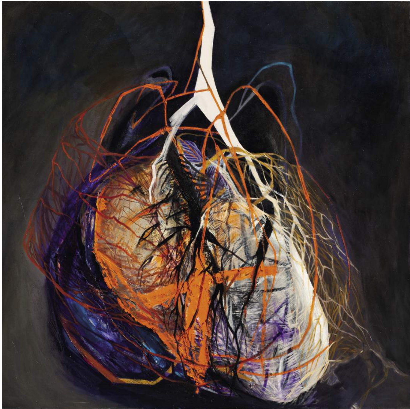
20 KWIATY 2, 2016, AKRYL, ΟΛΕJ, ΠΕΛΌΤIΝΟ, 150X150 CM