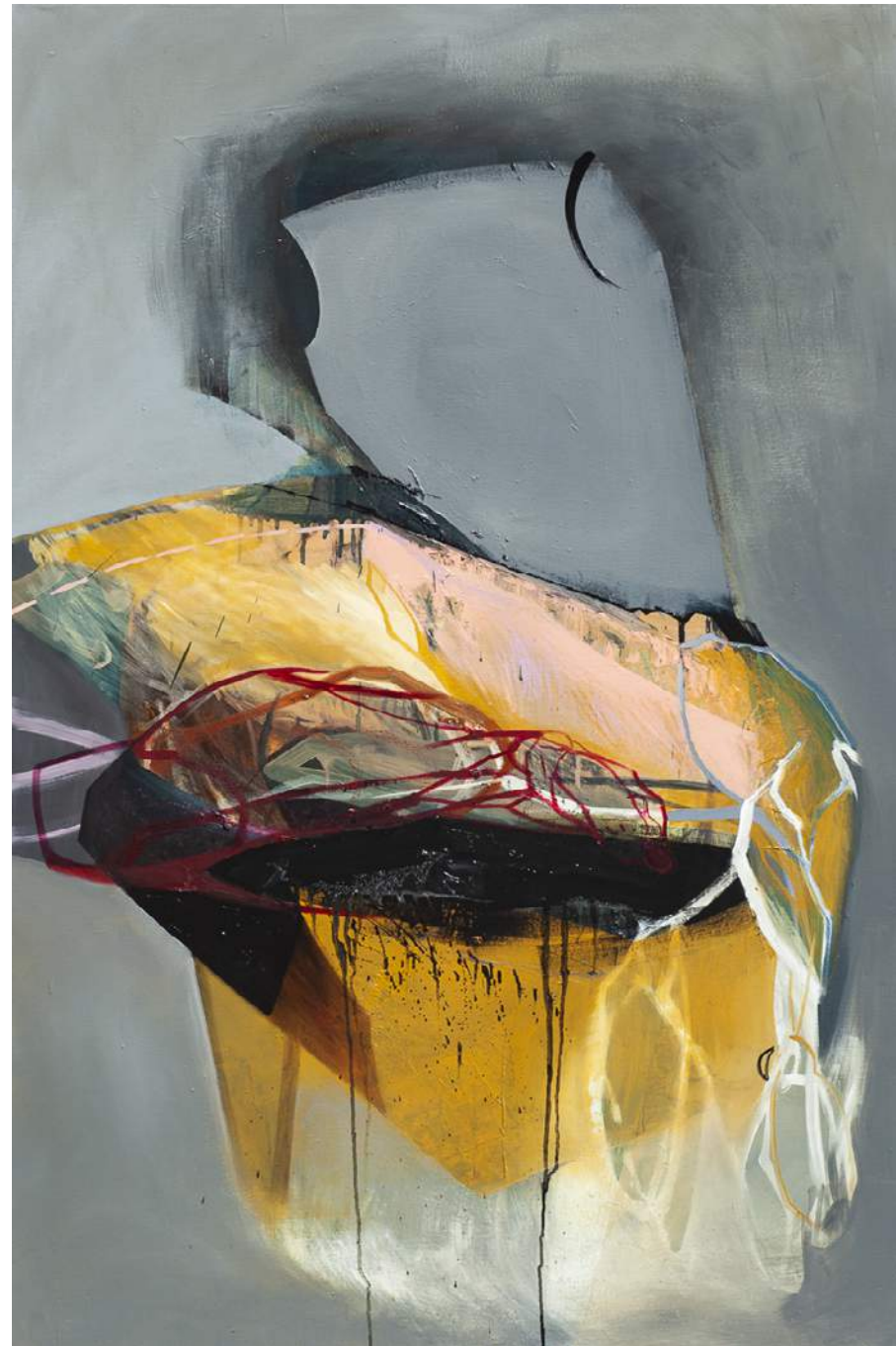
ODLAMKI 4, 2019, AKRYL, OLEJ, PŁÓTNO, 150X100 CM