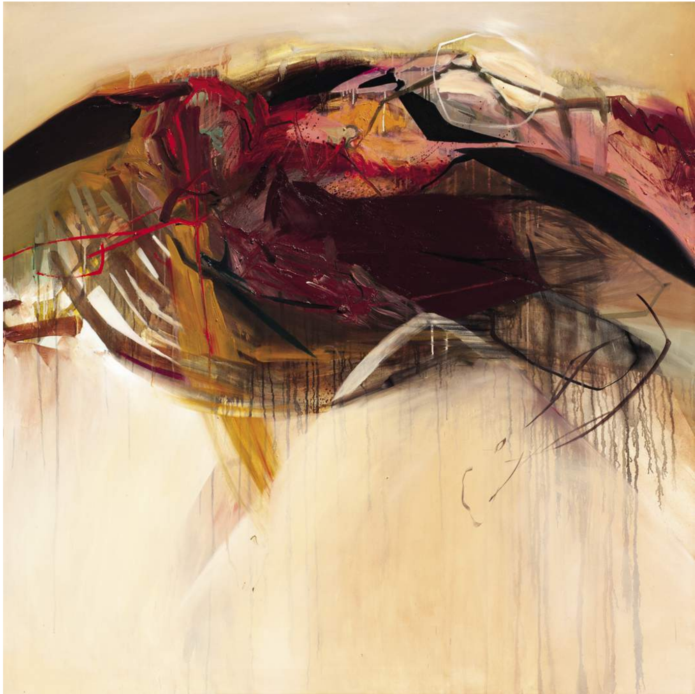
14 BAROK 14, 2017, AKRYL, OLEJ, PŁÓTNO, 130X130 CM