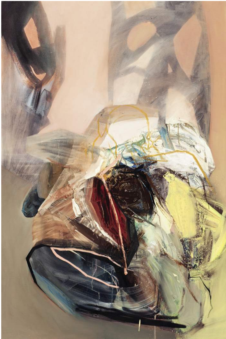
◦DŁAMKI 7, 2019, AKRYL, ◦LEJ, PŁÓTNO, 150X100 CM