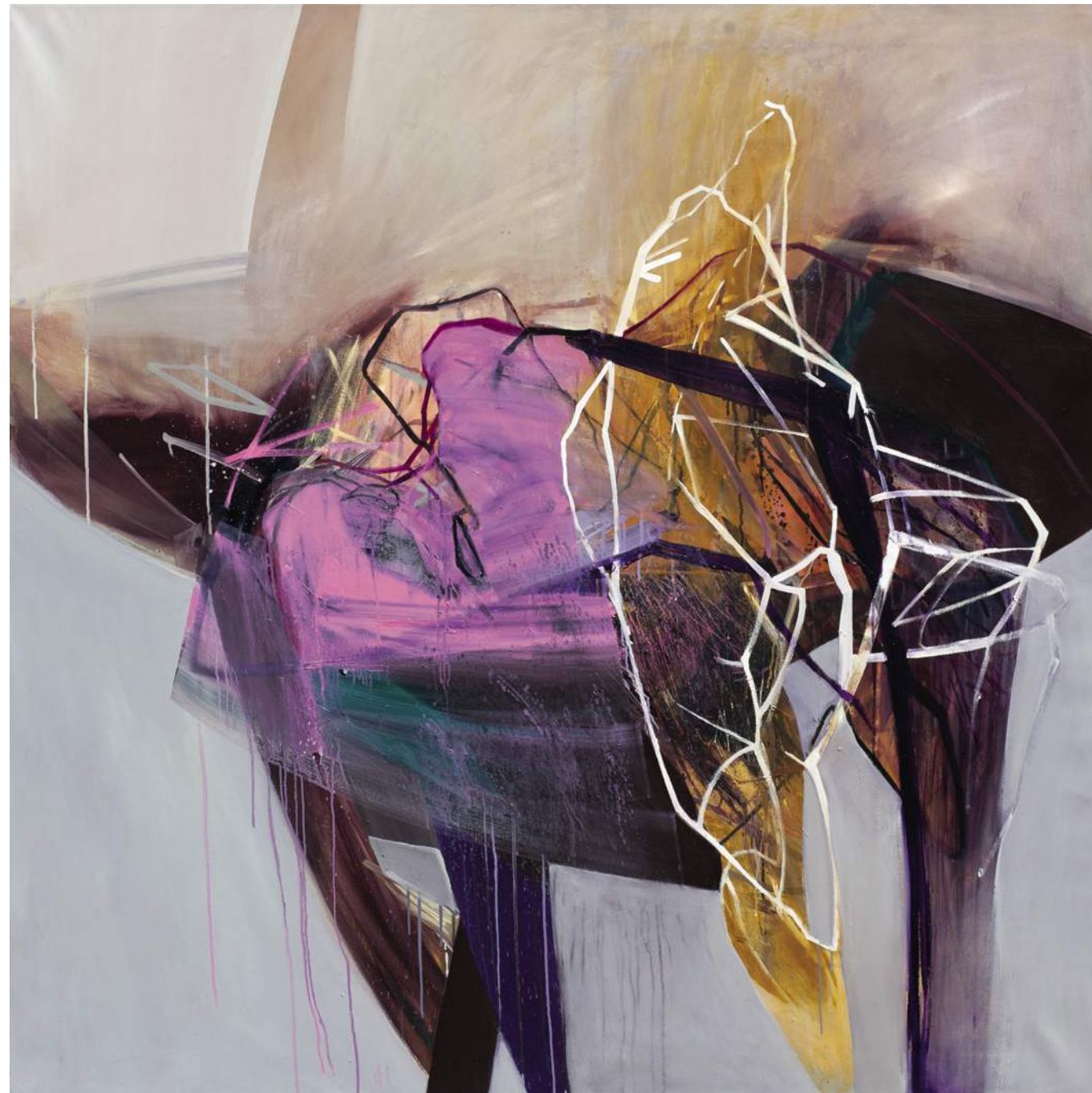
5 BAROK 15, 2018, AKRYL, OLEJ, PEŁÓTNÓ, 150X150 CM