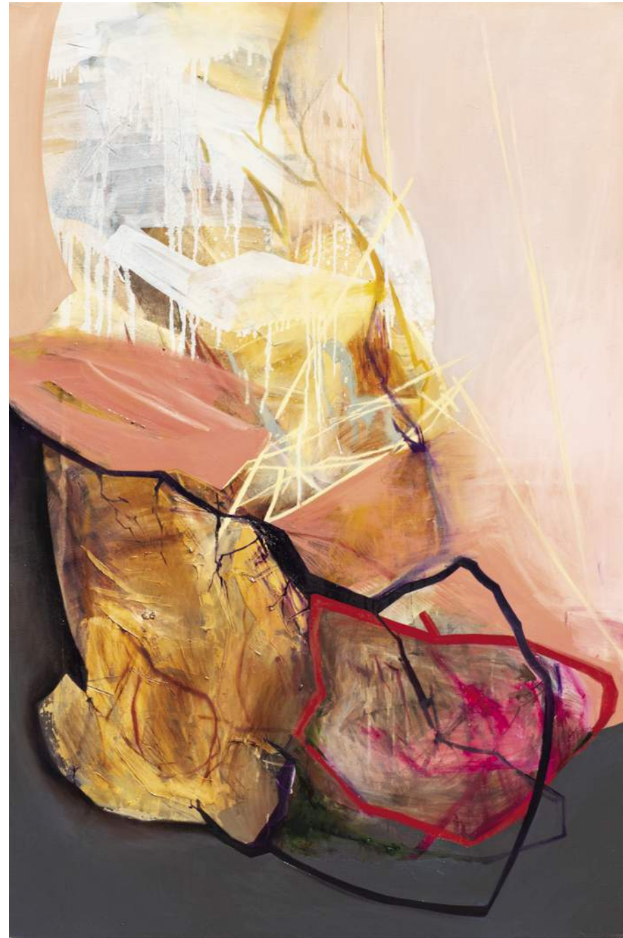
ΦΔΕΛΜΚI 5, 2019, AKRYL, ΟΛΕJ, ΠΕΛΌΤIΝΟ, 150X100CM