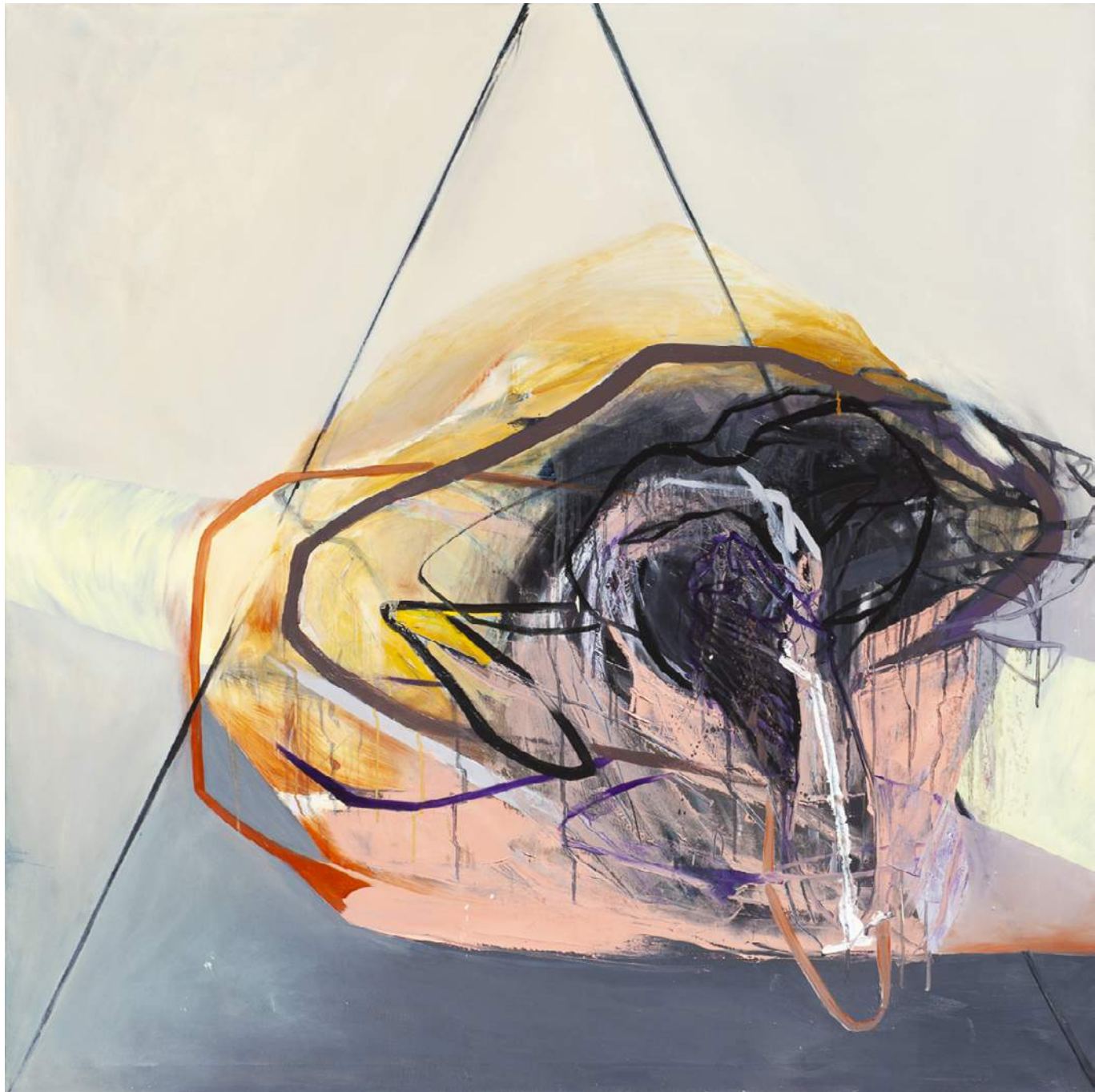
18 PODZIAŁY 1, 2016, AKRYL, OLEJ, PŁÓTNO, 130X130 CM