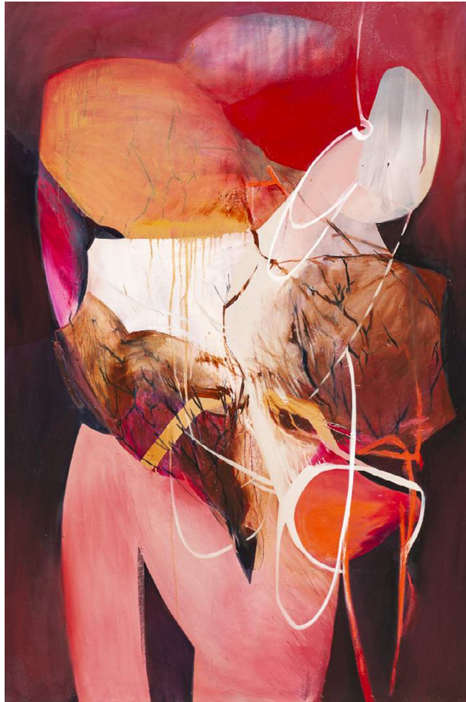
OΔAMKI 9, 2019, AKRYL, OLEJ, PŁÓTNO, 150X100CM