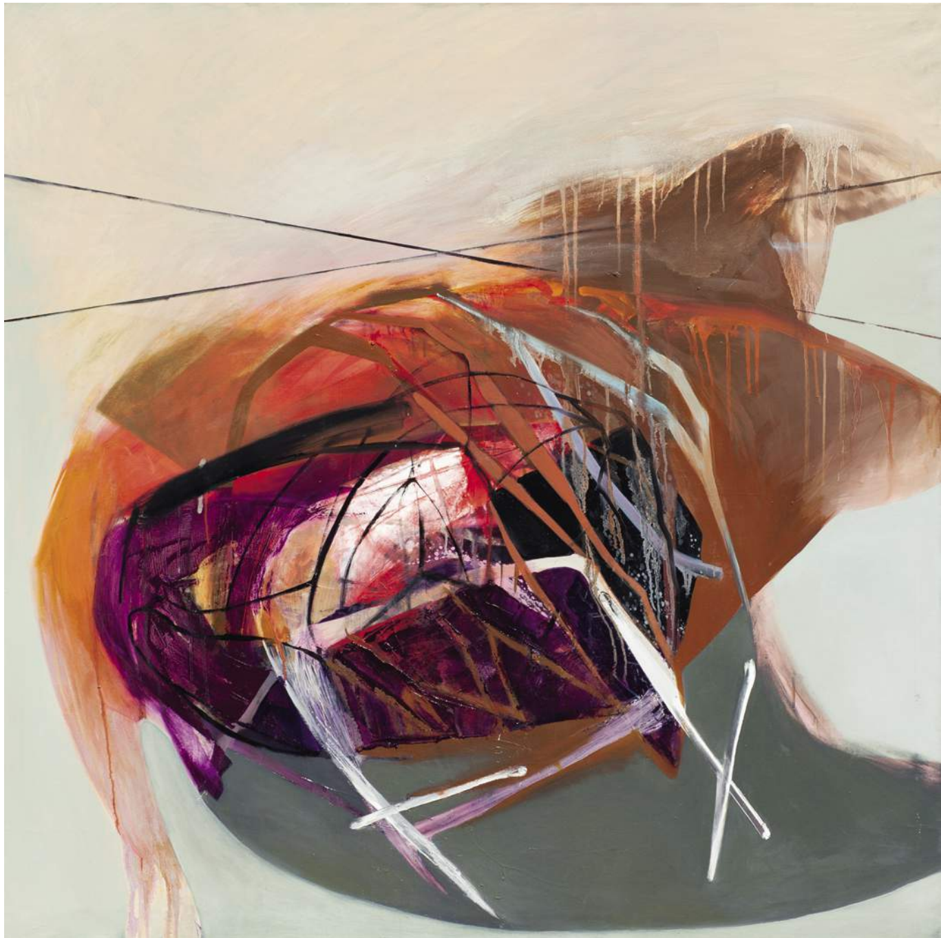
6 PODZIAŁY 2, 2016, AKRYL, OLEJ, PŁÓTNO, 130X130 CM