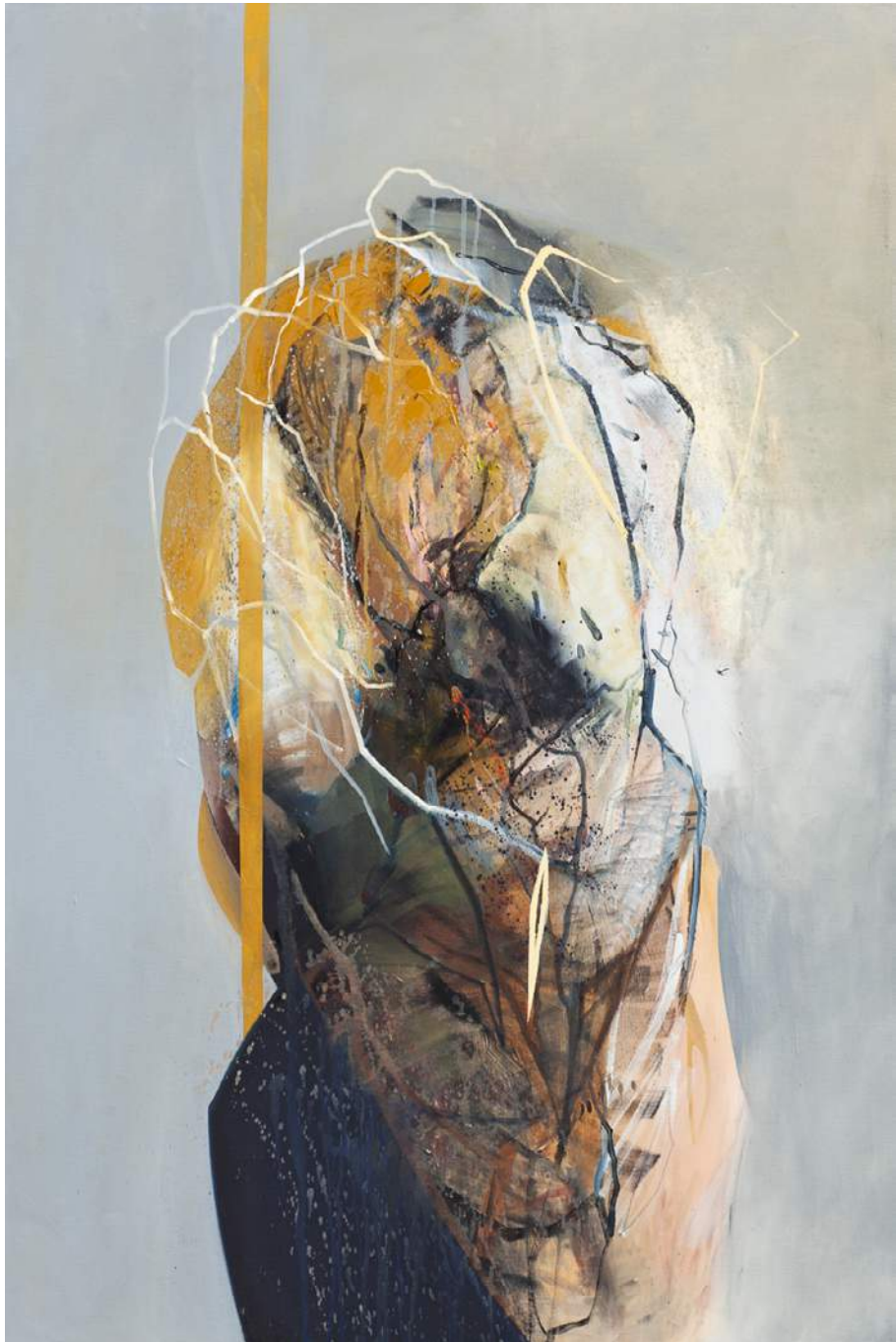
ΟΔΕΑΜΚΙ 1, 2019, ΑΚΡΥΛ, ΟΛΕJ, ΠΕΛΌΤΝΟ, 150X100CM