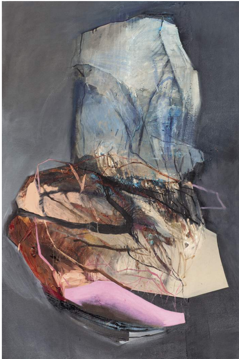
ODLAMKI 2, 2019, AKRYL, OLEJ, PŁÓTNO, 150X100 CM