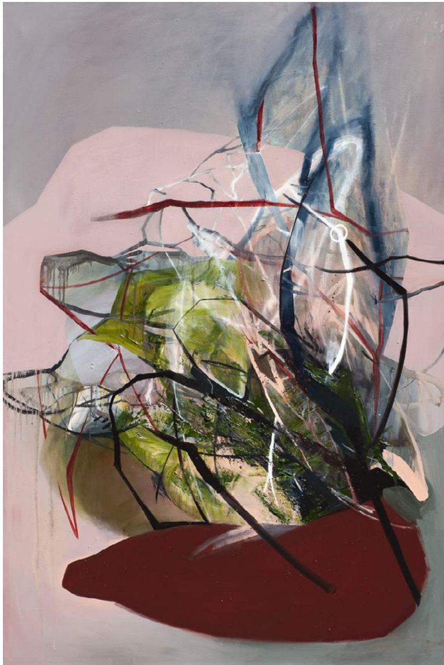
4 OŁAMKI 10, 2019, AKRYL, OLEJ, PEŁÓTNÓ, 150X100 CM