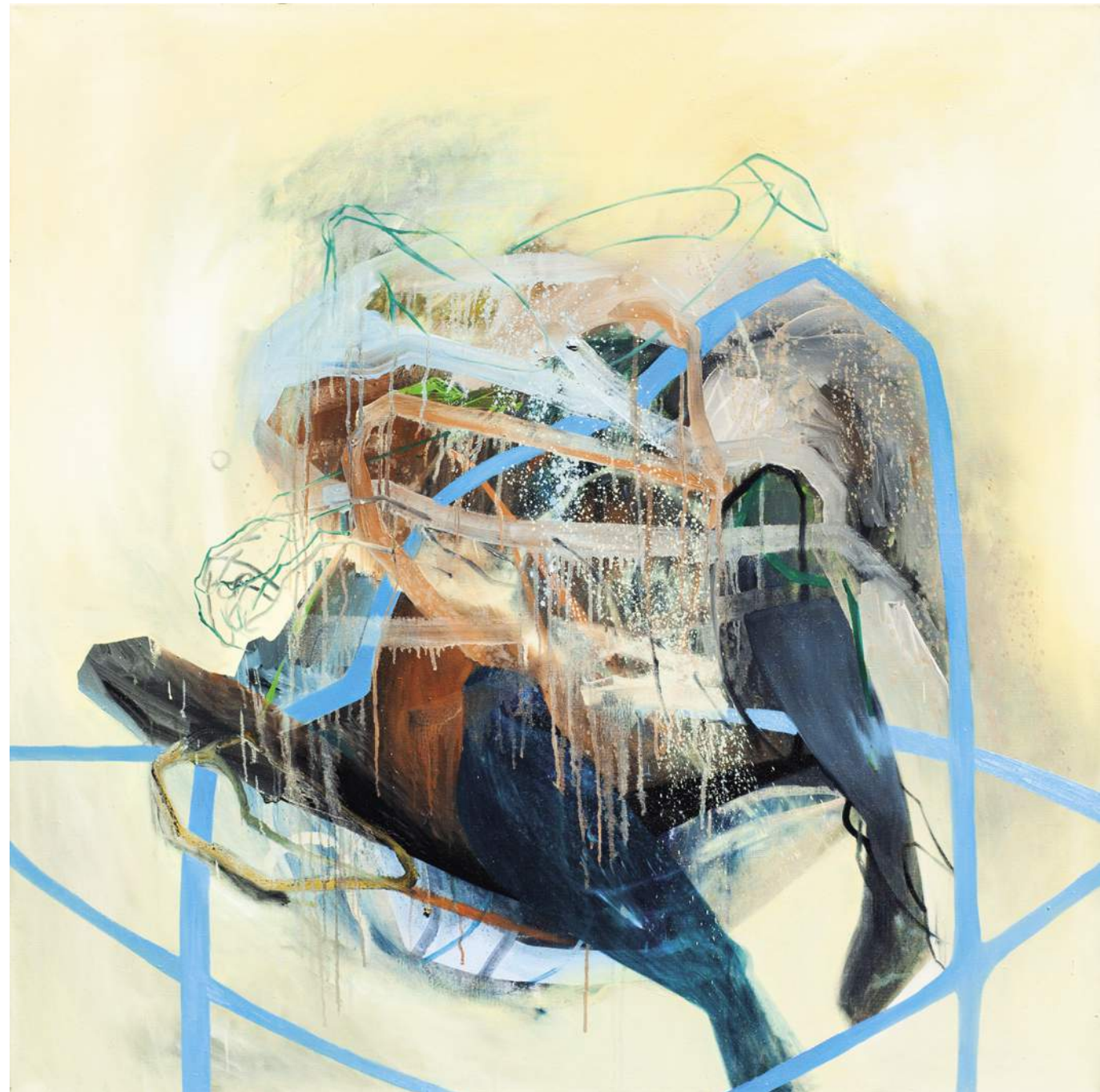
BAROK 5, 2017, AKRYL, OLEJ, PŁÓTNO, 130X130 CM