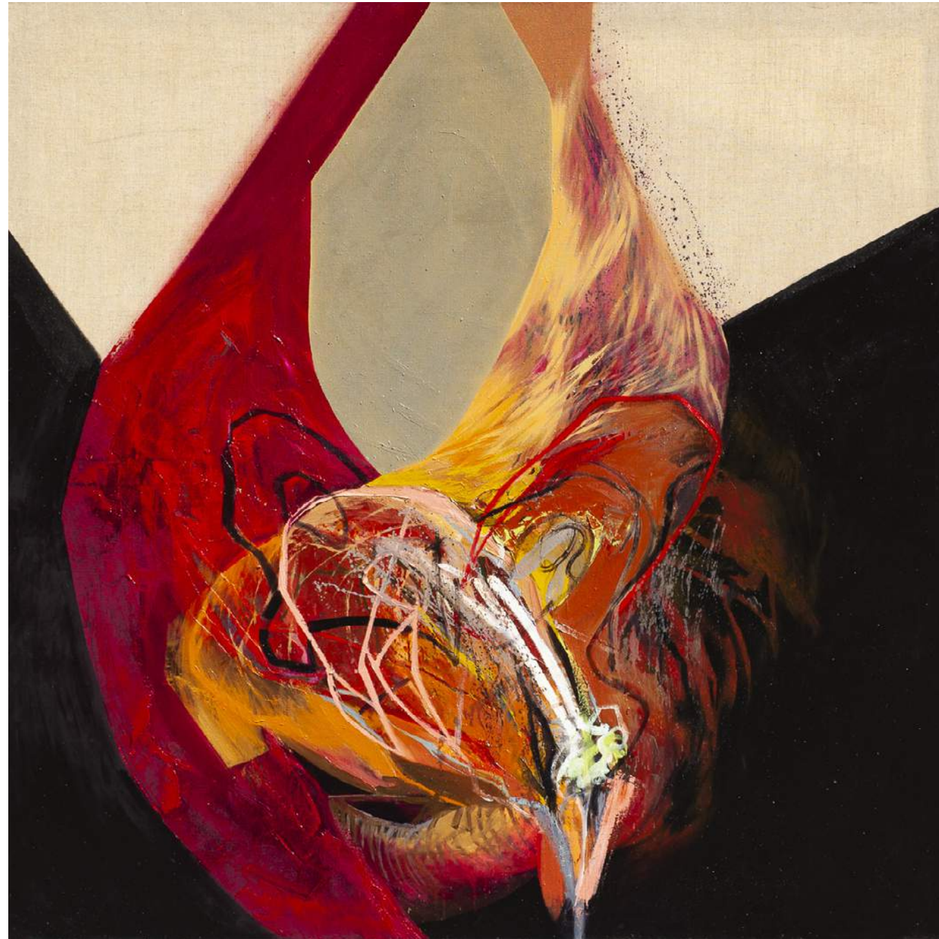
KWIATY 1, 2016, ΑΚΡΥΛ, ΟΛΕJ, ΠΕΛΌΤΝΟ, 150X150 CM